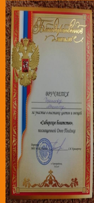
Выставка в ДК «Сибирское богатство»