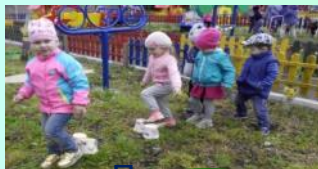
Препятствия для хождения змейкой или перешагивания