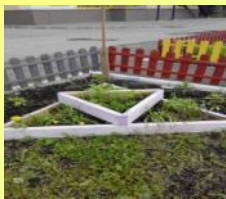
Фигуры для прокатывания мяча