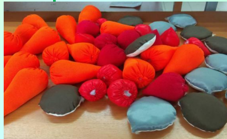
Пошив ягод и овощей для забрасывания