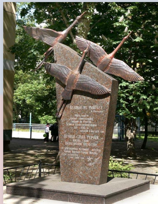
Памятник героям - тимирязевцам