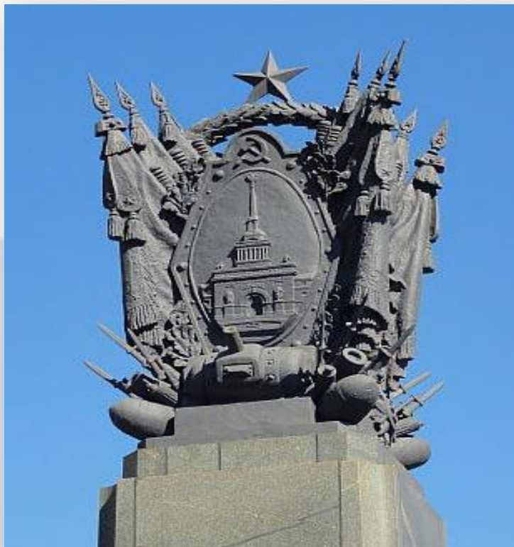
Фрагмент скульптурной композиции на Мосту Победы