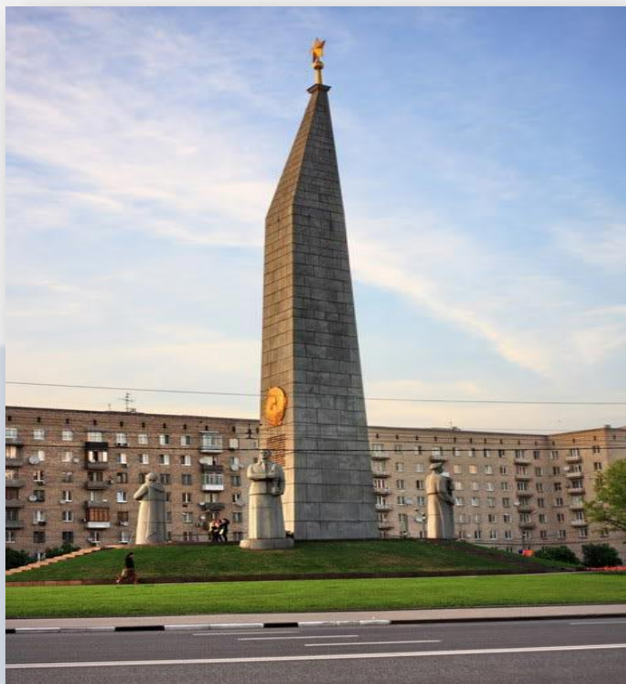
Стелла «Москва - Город-Герой» на площади Дрогомилловской заставы