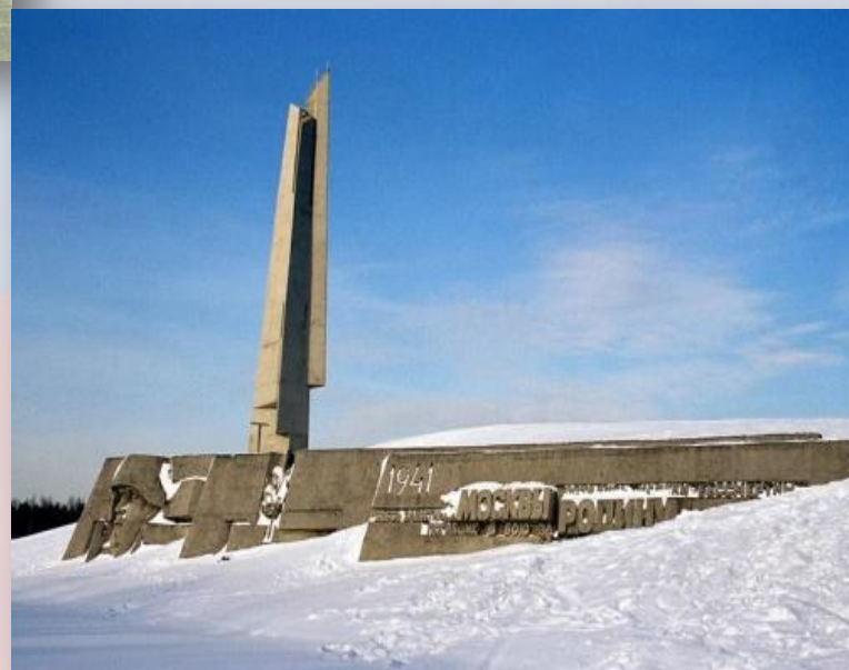
Монумент "Защитникам Москвы" (Ленинградское шоссе)