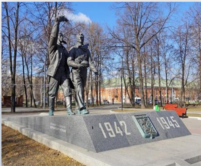
Ветеранам авиapolкa "Нормандия-Неман"