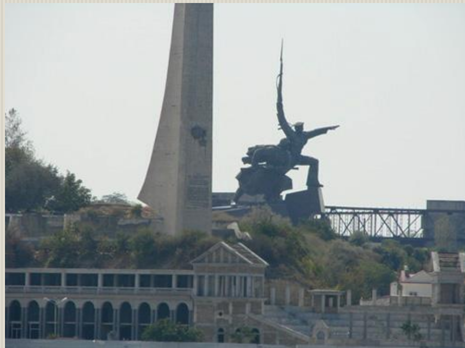
Памятник Героям обороны Севастополя