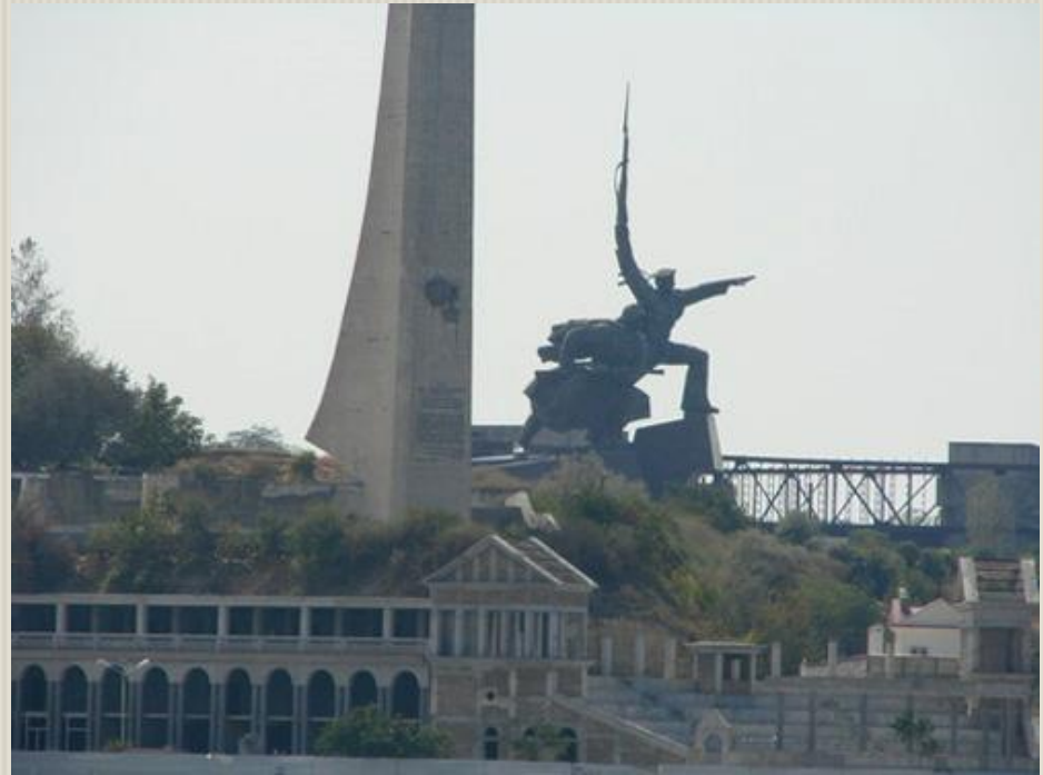
Памятник Героям обороны Севастополя