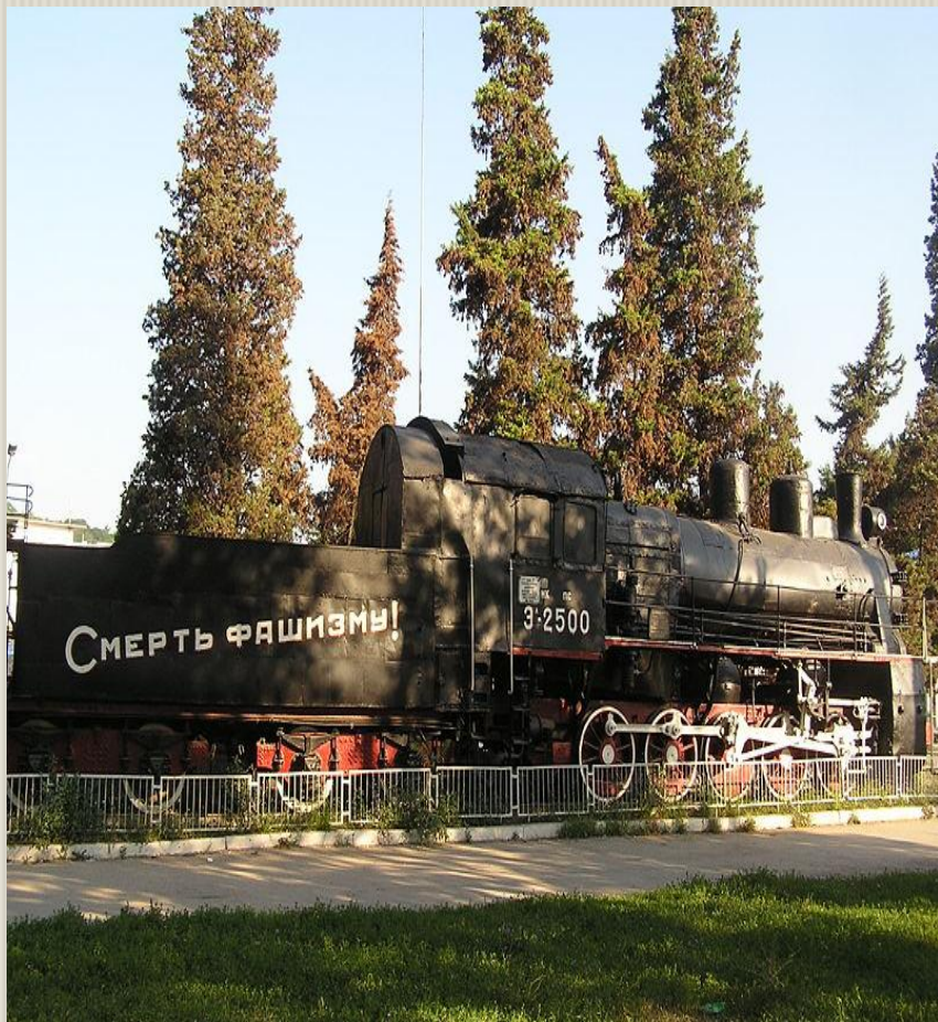
Паровоз бронепоезда «Железняков»