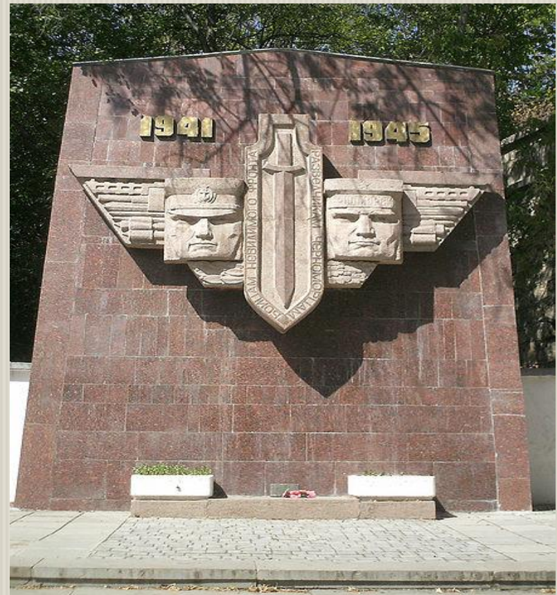
Памятник разведчикам черноморского флота