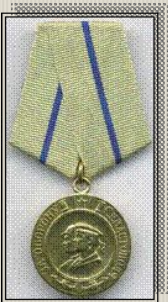
Медаль «За оборону Севастополя»

Медаль «За оборону Севастополя» учреждена Указом Президиума Верховного Совета СССР от 22 декабря 1942 г. Автор рисунка медали – художник Н. Москалев. Положение о медали дополнено «Указом Президиума Верховного Совета СССР» от 19 июня 1943 г., а в описание медали внесены изменения Постановлениями Президиума Верховного Совета СССР от 27 марта и 3 мая 1943 г. Медаль «За оборону Севастополя» вручалась как участвовавшим в обороне города в течение всего периода обороны, так и тем участникам обороны, которые в связи с ранением, болезнью или в порядке проводимых правительственных мероприятий были эвакуированы из города в период его обороны. Медаль «За оборону Севастополя» вручалась защитникам этого города независимо от того, были ли они награждены орденами и медалями за мужество и отвагу, проявленные при обороне города, или нет. Всего медалью «За оборону Севастополя» награждено около 50 тысяч человек.