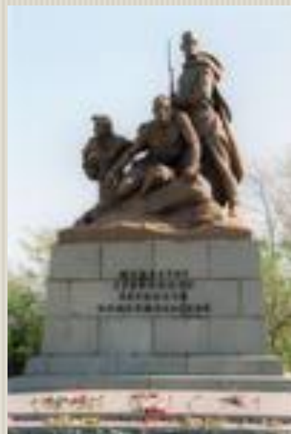
Памятник комсомольцам, погибшим в годы Великой Отечественной войны