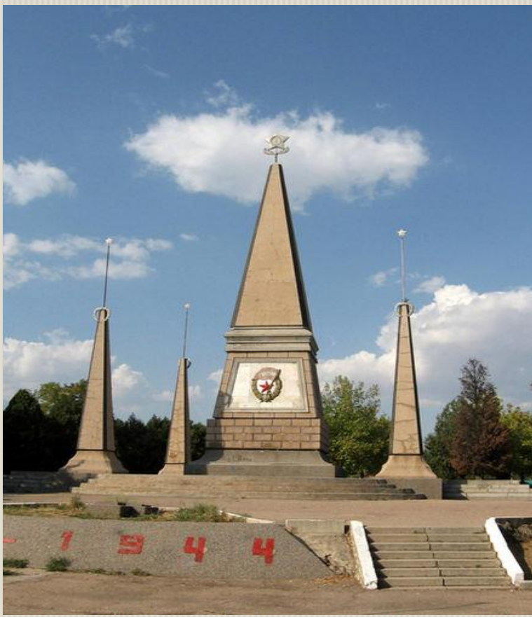
2 – я гвардейская армия