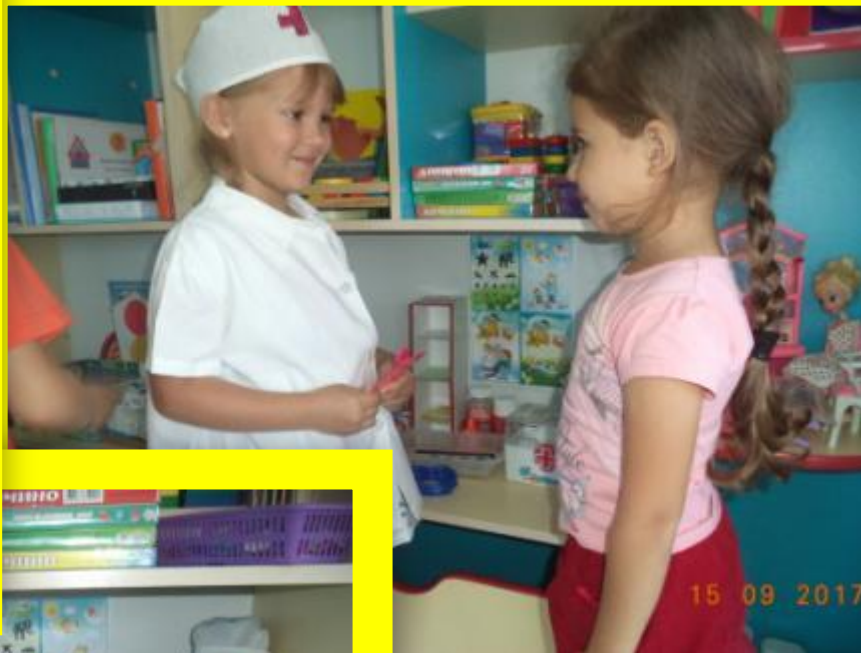
С С/р игра «Больница»