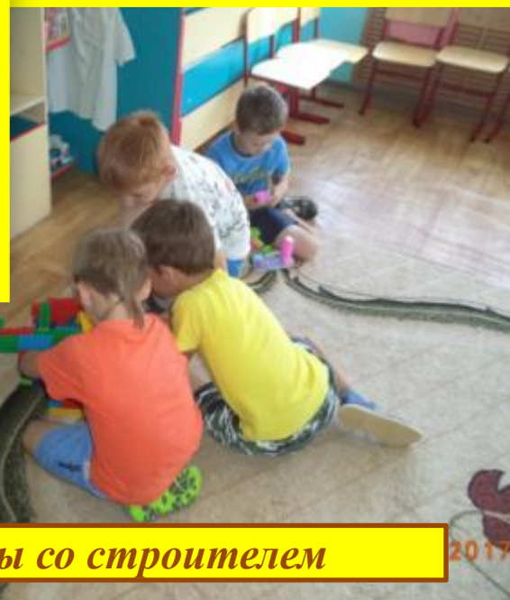
Игры со строителем