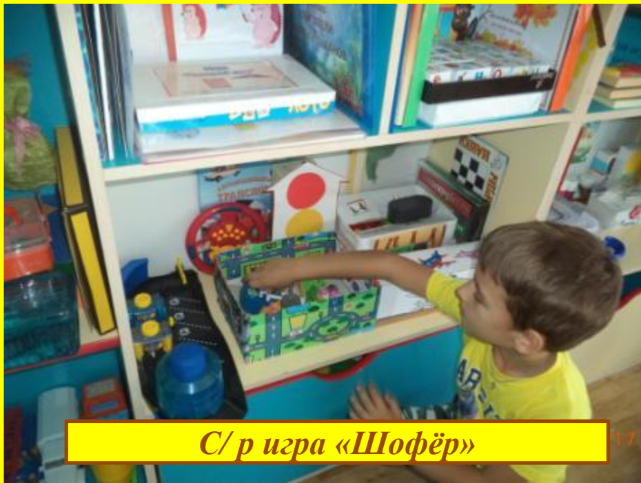
С/р игра «Шофёр»