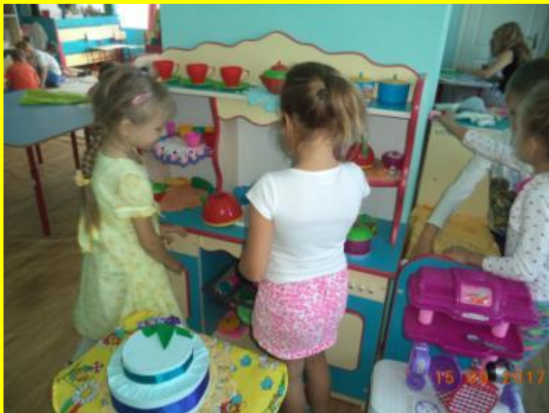
С/Р игра «Семья»