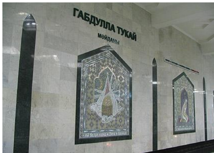
Казан шәһәренең Габдулла Тукай мөйданы.