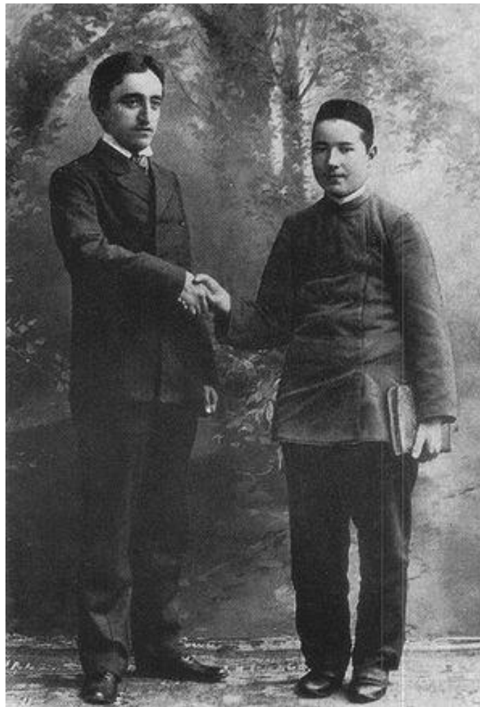
1905 ел. Г.Тукай