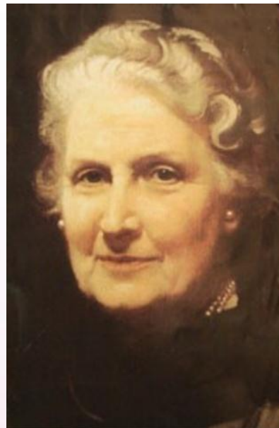
MARIA MONTESSORI (1870 - 1952)

Феномен педагогики Монтессори заключается в ее безграничной вере в природу ребенка, в ее стремлении исключить какое-либо авторитарное давление на формирующегося человека, а также в ориентации на свободную, самостоятельную, активную личность!