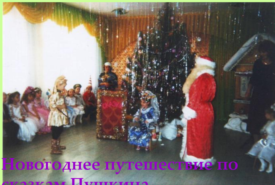
Новогоднее путешествие по сказкам Пушкина