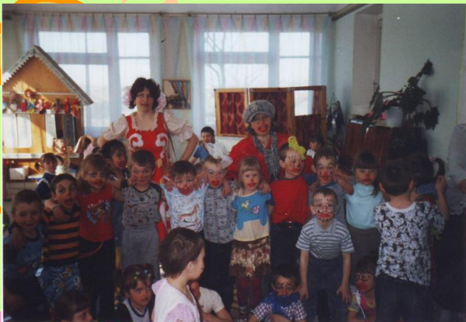
1 Апреля – «Веселые превращения»