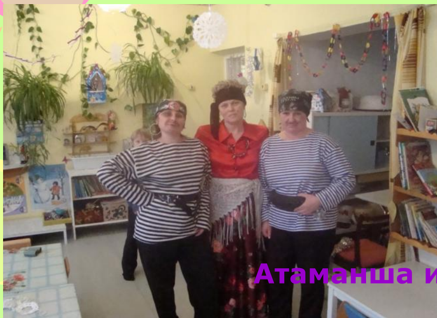
Атаманша и разбойники