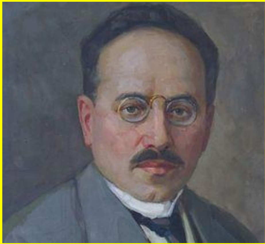
Антон Семёнович Макаренко выдающийся советский педагог

« Игра имеет важное значение в жизни ребёнка, имеет то же значение, какое у взрослого имеют деятельность, работа, служба. Каков ребёнок в игре, таков во многом он будет в работе, когда вырастет. Поэтому воспитание будущего деятеля происходит, прежде всего, в игре. И вся история отдельного человека как деятеля и работника может быть представлена в развитии игры и в постепенном переходе её в работу.»