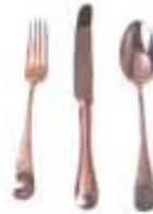
ВИЛКА, НОЖ, ЛОЖКА