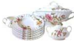
НАБОР СТОЛОВОЙ ПОСУДЫ