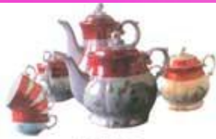
НАБОР ЧАЙНОЙ ПОСУДЫ