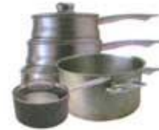
НАБОР КУХОННОЙ ПОСУДЫ