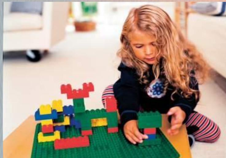
Гигантский набор Дупло

Разнообразие лего конструкторов позволяет заниматься с обучающимися разного возраста и различных образовательных возможностей.