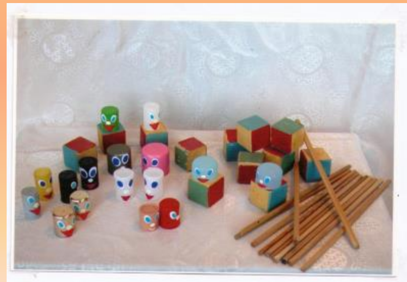
Музыкальные крышечки, кубики, палочки