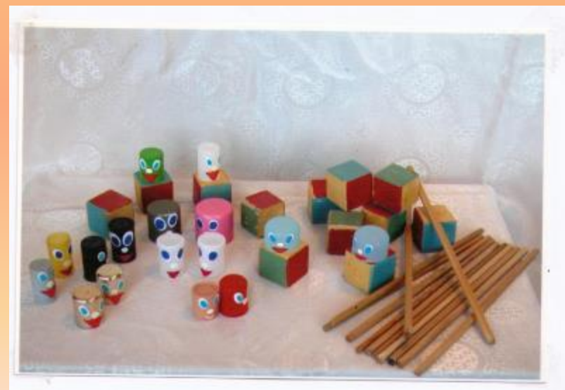
Музыкальные крышечки, кубики, палочки