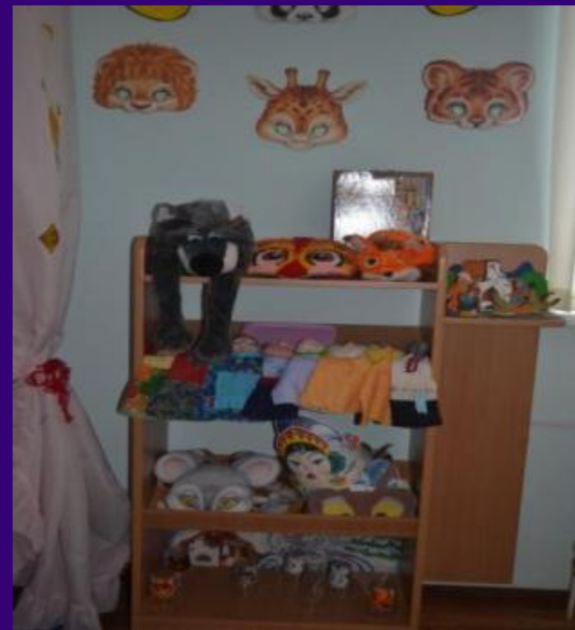
Центр театра в средних группах