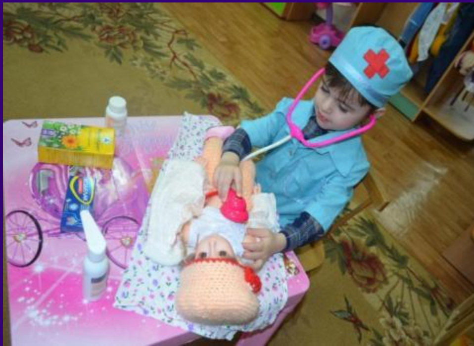
С / р игра «Больница»