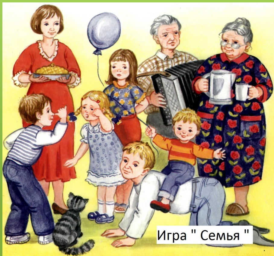
Игра " Семья "

И венцом в развитии речи является сюжетно – ролевая игра. Ролевые игры создают ситуацию для общения и условия для возникновения спонтанной речи.