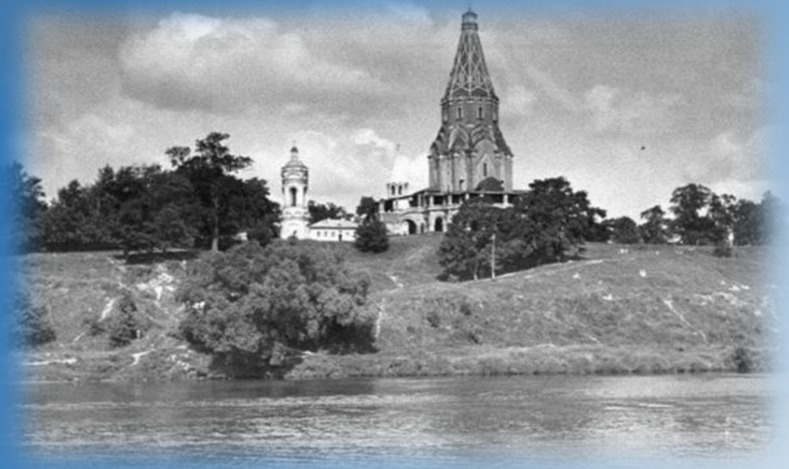
село Коломенское Вознесенская церковь...