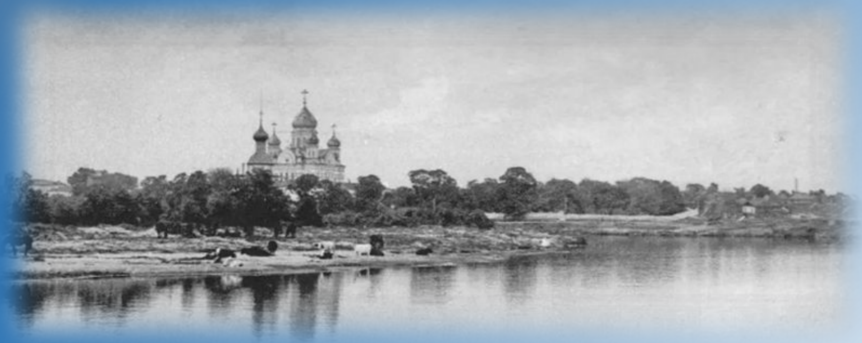
Слобода Перерва Бронницкого уезда