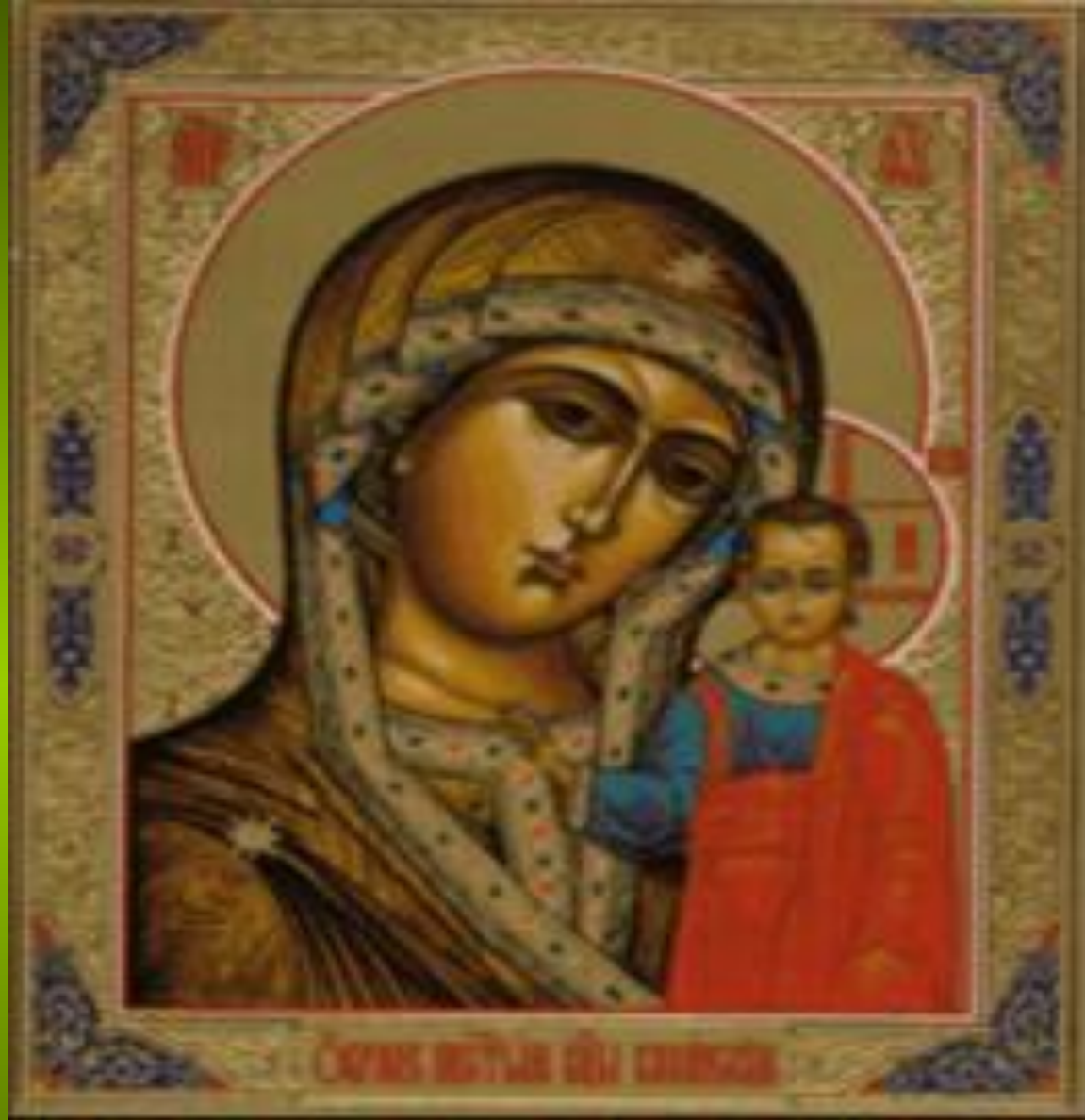
Казанская Божья Матерь