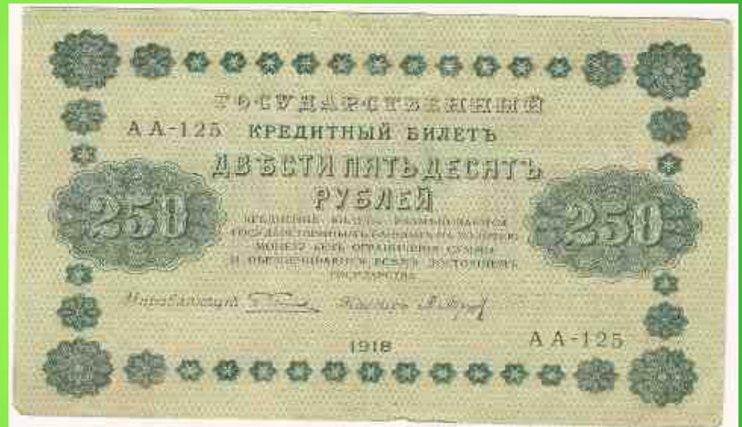
купюра 1918 г.