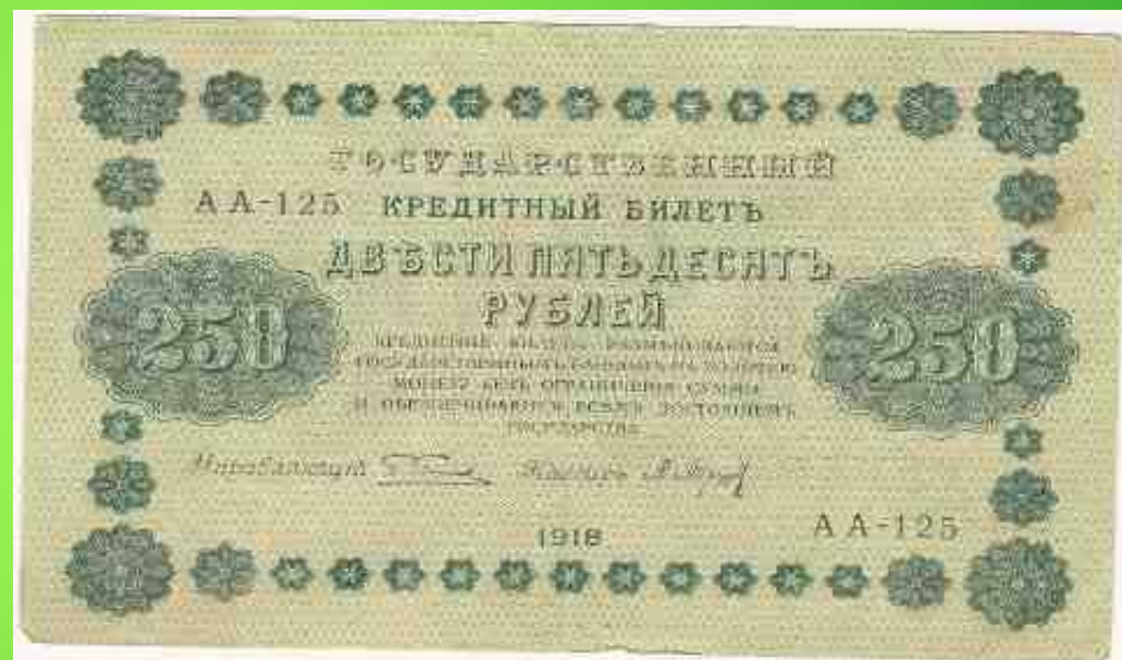
купюра 1918 г.