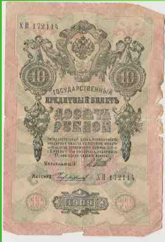
купюра 1909 г.