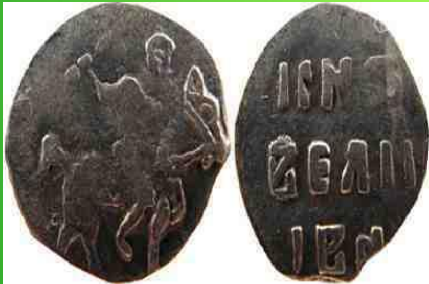
Денга-"московка" времен Ивана Грозного

На мелкой серебряной монете изображали всадника с мечом.