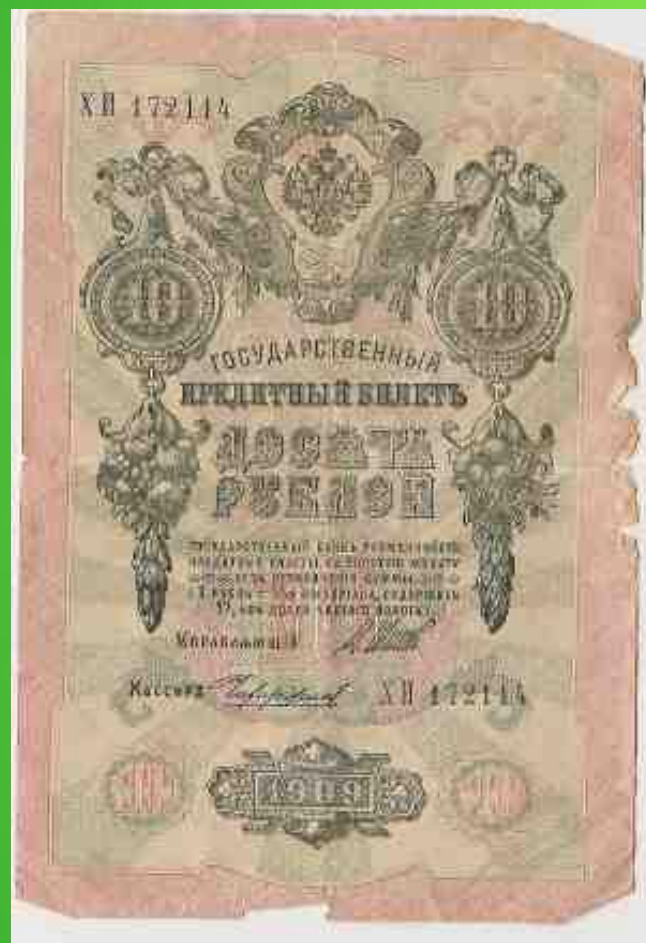
купюра 1909 г.