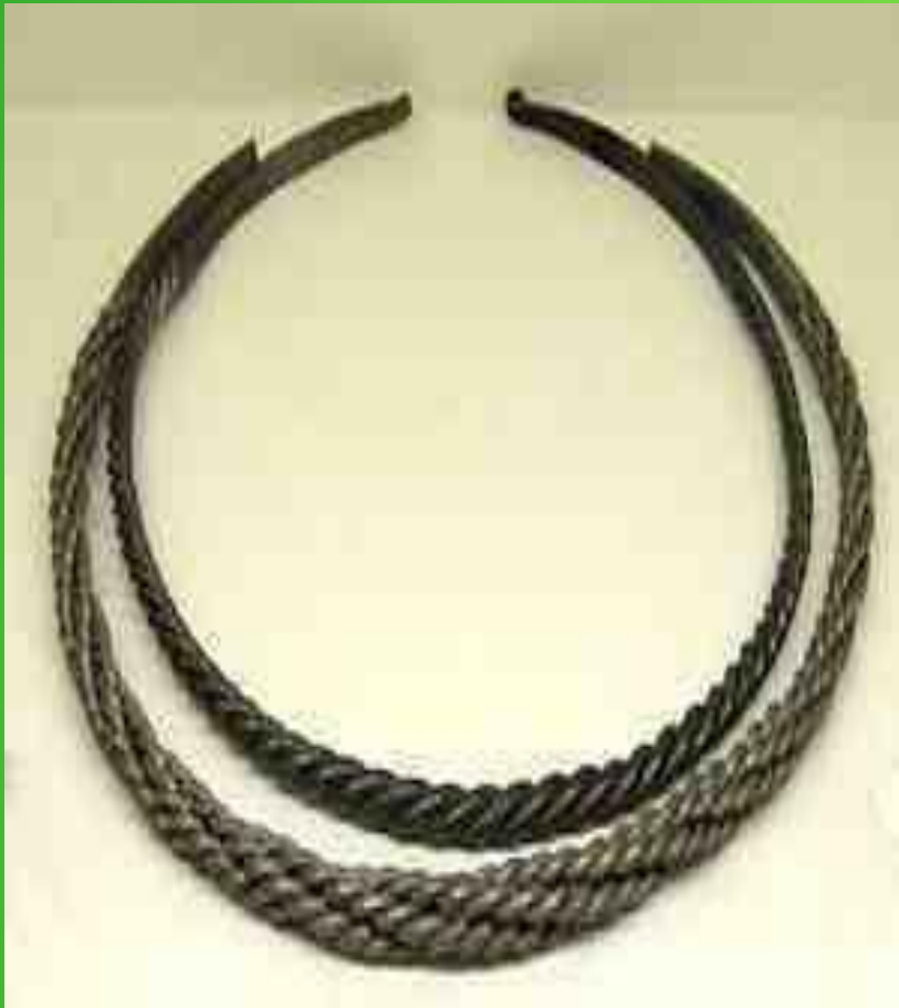
Русь, начало 13 века. ( серебро, медь, плетение, кожа)

В старину на Руси женщины носили на шее ожерелье из драгоценного металла - гривну . За гривну давали кусок серебра определенного веса. Этот вес назывался гривной .