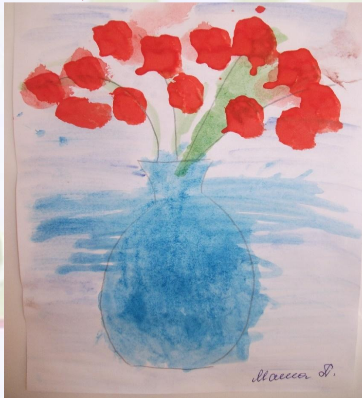
Рисунок тогда, получается, по сырому, когда в еще не засохший фон вкрапывается краска и разляпывается тампоном или широкой кистью.