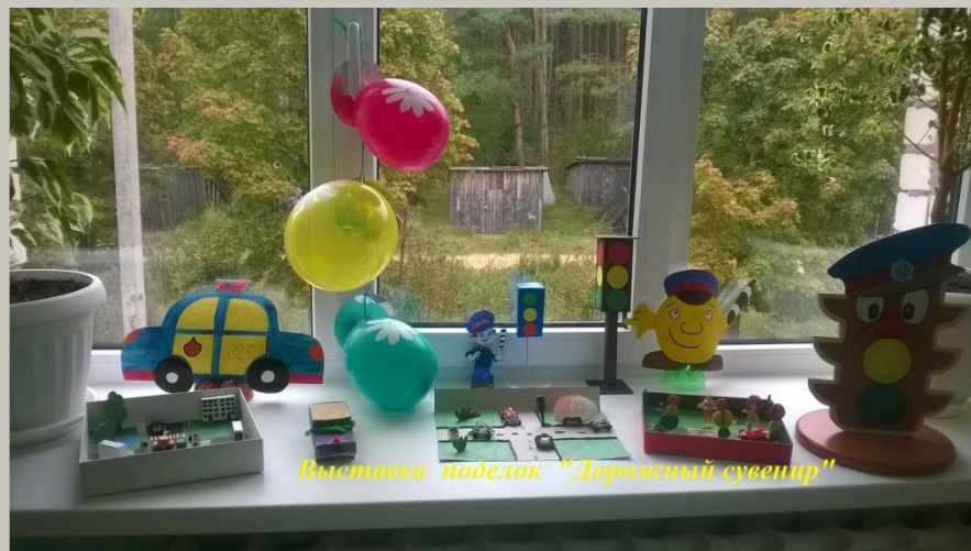
Выставка поделок "Дорожный сувенир"