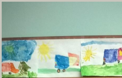
Выставка творческих работ

Цель: Развитие и обогащение социально-личностного опыта посредством включения детей в сферу межличностного взаимодействия.