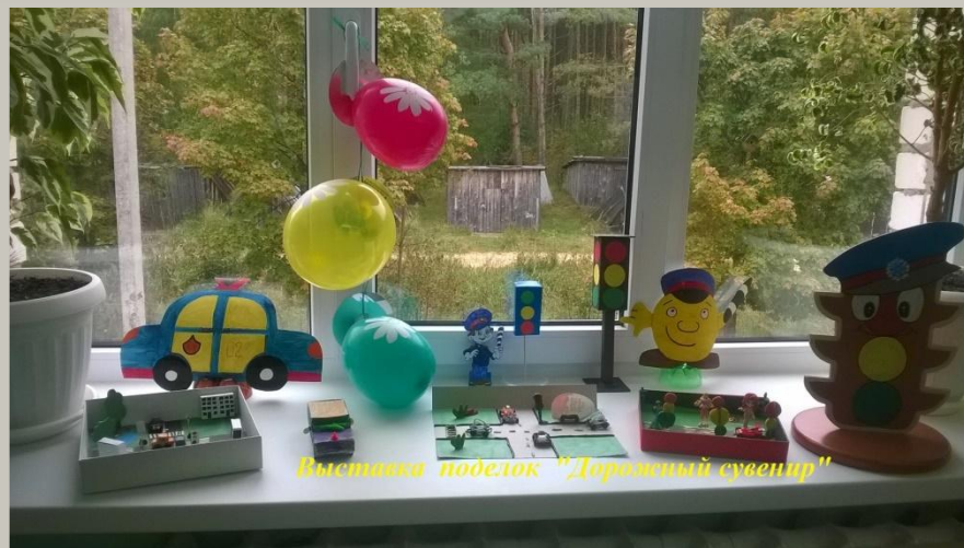
Выставка поделок "Дорожный сувенир"