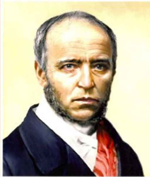
Владимир Федорович Одоевский