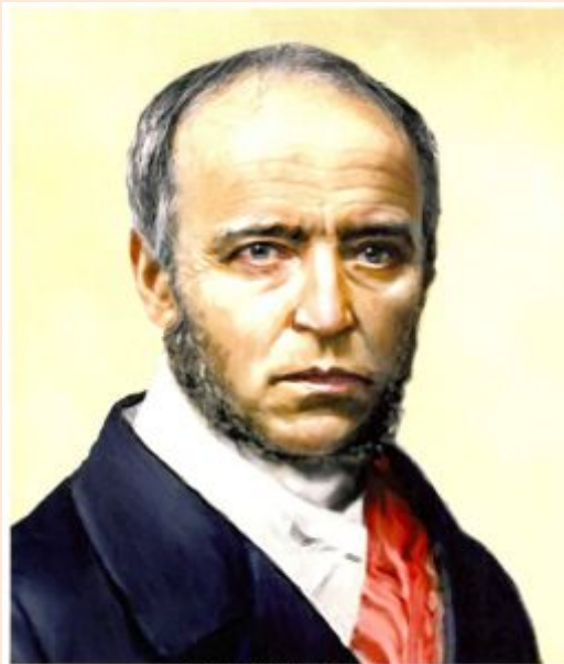
Владимир Федорович Одоевский