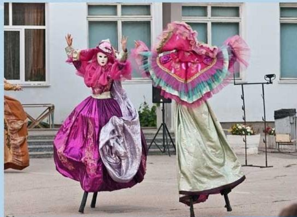
Театр на ходулях. Евпатория.

Вьетнамский кукольный театр на воде. История вьетнамского театра насчитывает больше 1000 лет. Считается, что его придумали крестьяне, чьи рисовые поля из раза в раз страдали от затопления. По сей день во вьетнамском театре нет сцены — все выступления проходят прямо в воде! Для этого используются как искусственные, так и естественные водоемы, на которых прорубаются декорации.