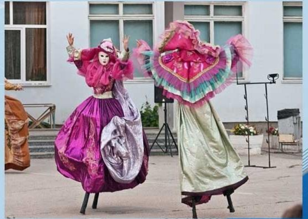
Театр на ходулях. Евпатория.