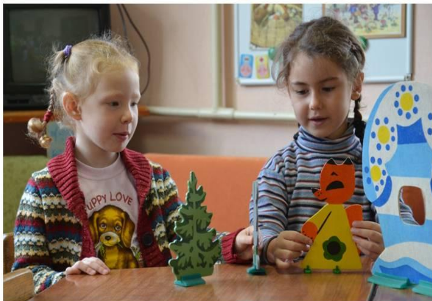
Настольный кукольный театр