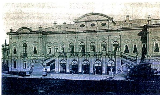
ИВНЯ. Главный и парковый фасады дворца Клеймихелей. Фото нач. XX в.