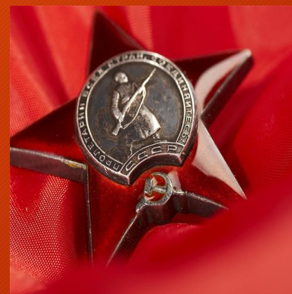
Орден Красная звезда