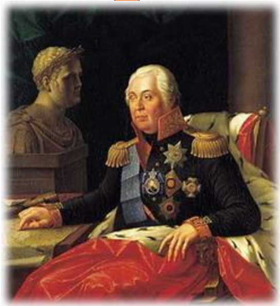
М. И. Кутузов 1745- 1813