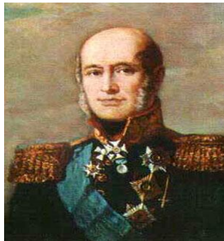
М. Б. Барклай- де- Толли 1761- 1818