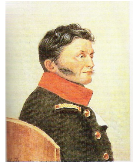
Н. Н. Раевский 1771- 1829