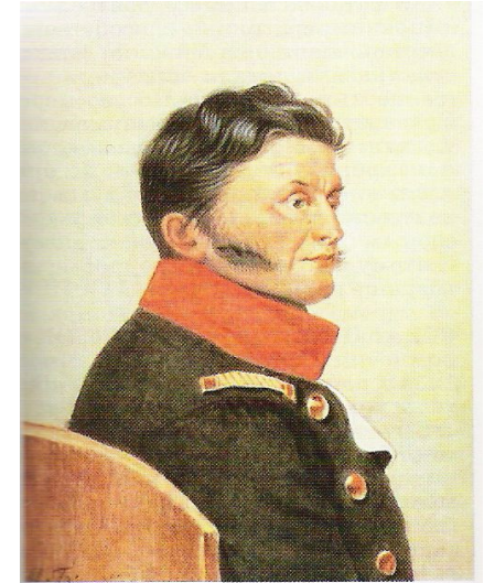
Н. Н. Раевский 1771- 1829