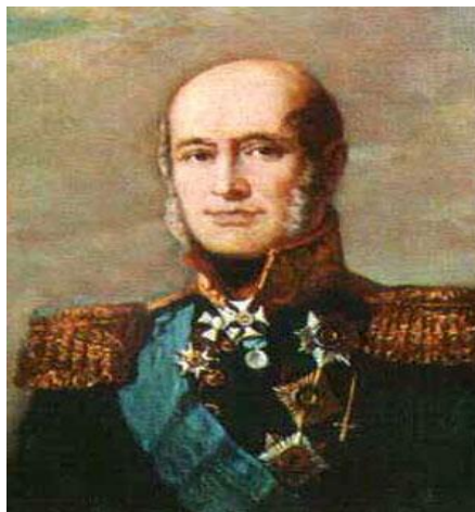
М. Б. Барклай- де- Толли 1761- 1818