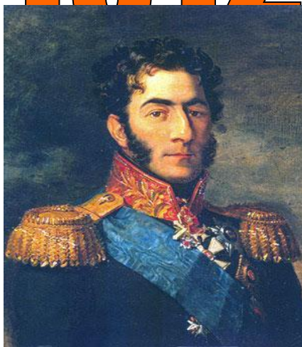
П. И. Багратион 1765- 1812