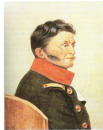
Н. Н. Раевский 1771- 1829