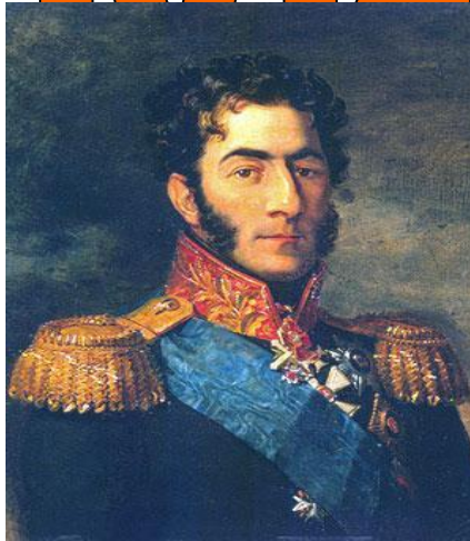
П. И. Багратион 1765- 1812