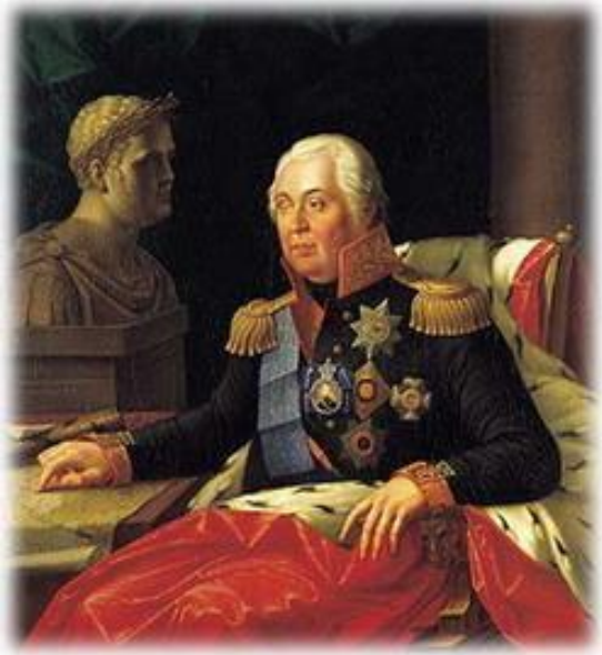
М. И. Кутузов 1745- 1813