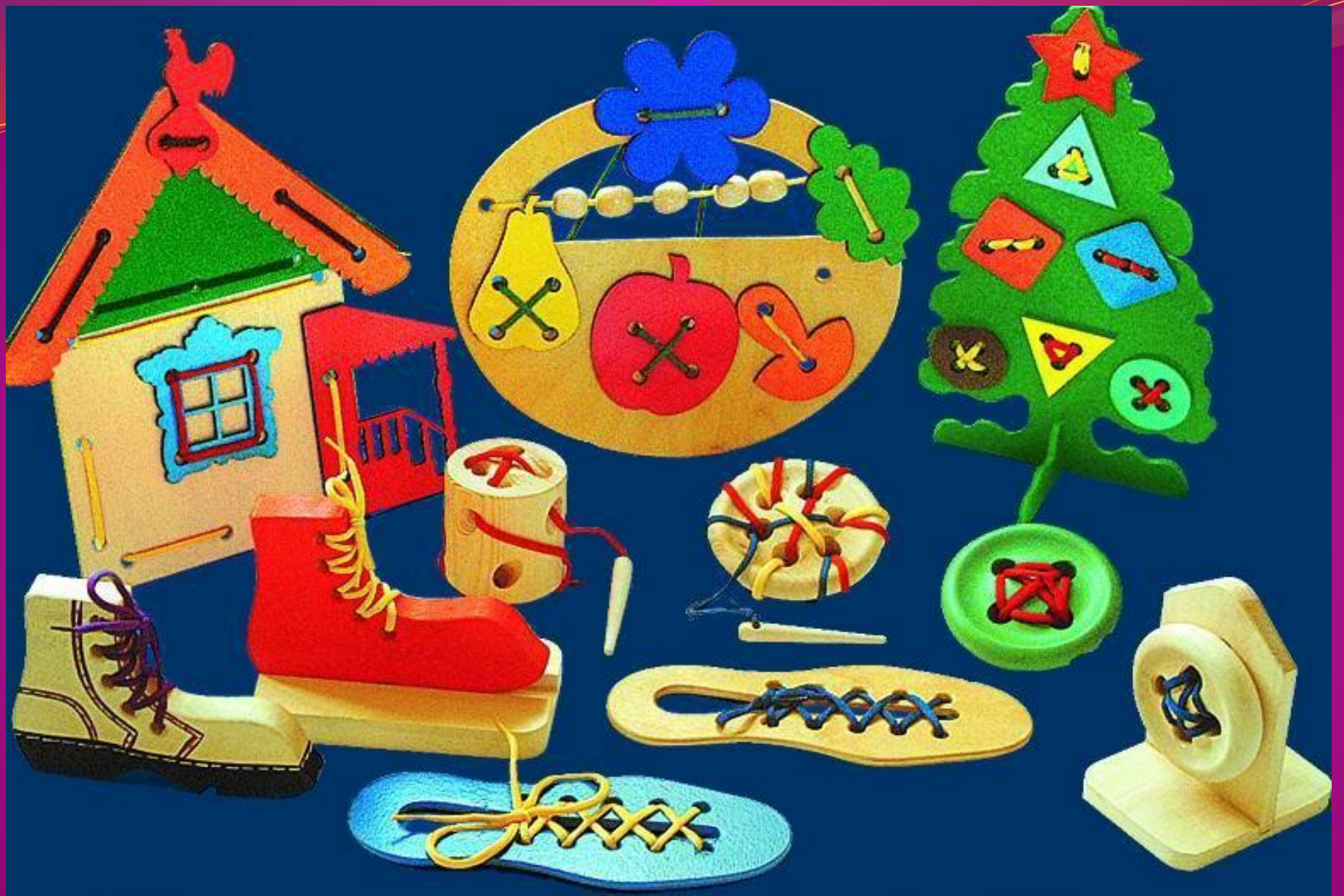
Игрушки - шнуровки