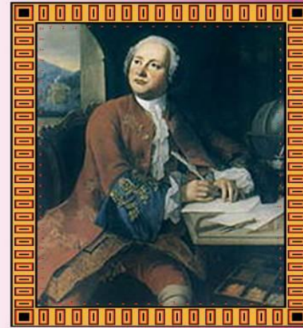
Михаил Васильевич Ломоносов 1711 - 1765