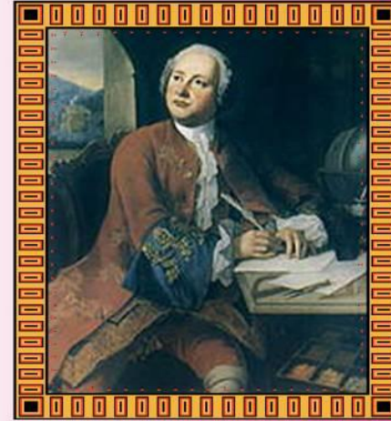
Михаил Васильевич Ломоносов 1711 - 1765