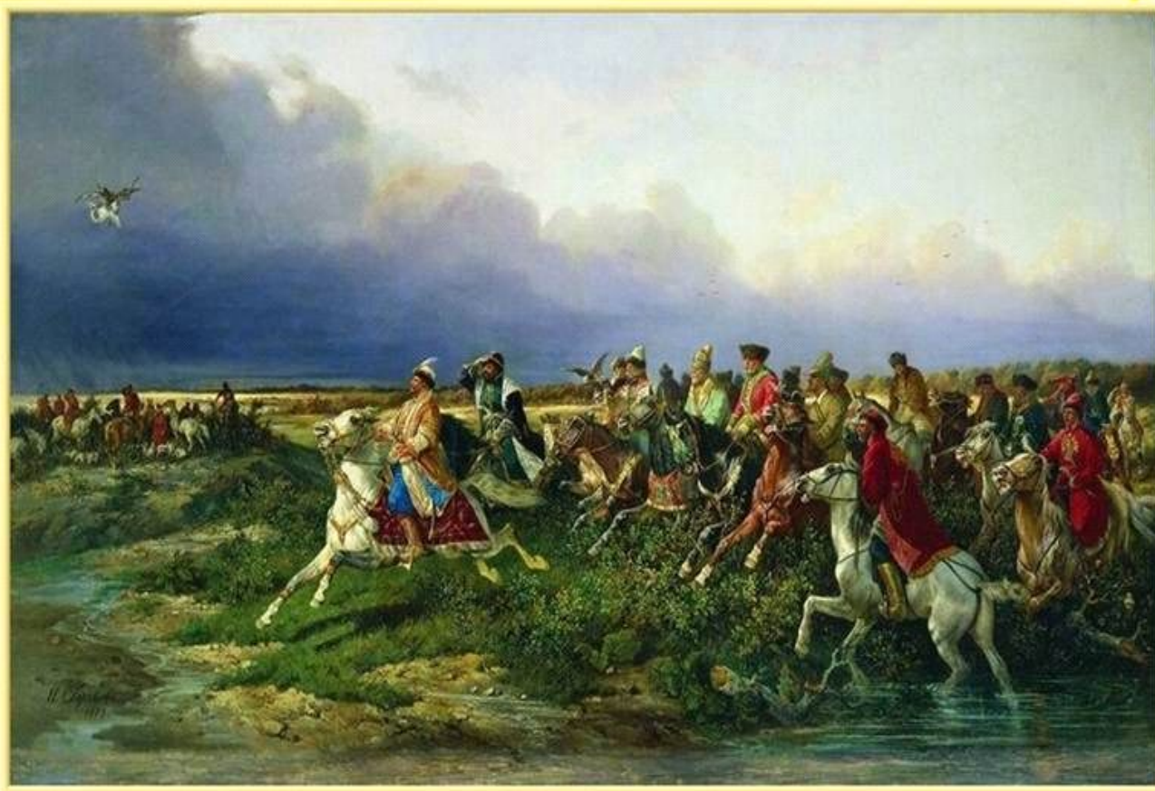
Н. Е. Сверчков Царь Алексей Михайлович с боярами на соколиной охоте