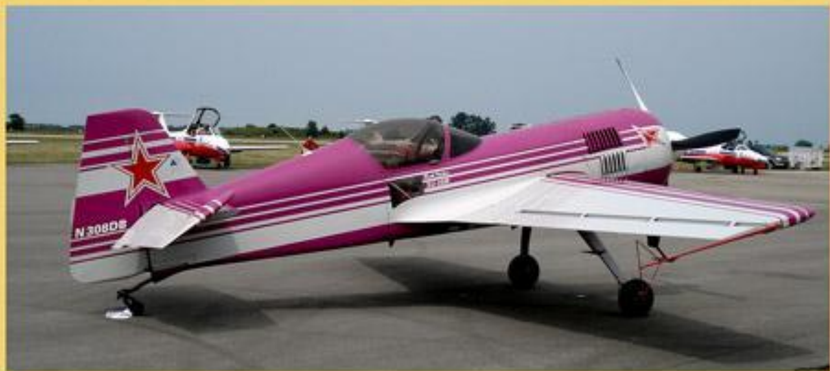
Спортивный пилотажный самолет