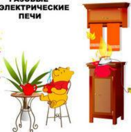
ОСТАВЛЕННЫЕ БЕЗ ПРИСМОТРА ЭЛЕКТРОПРИБОРЫ