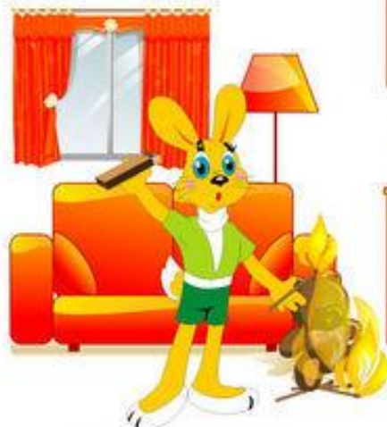
НЕОСТОРОЖНОЕ ОБРАЩЕНИЕ С ОГНЁМ