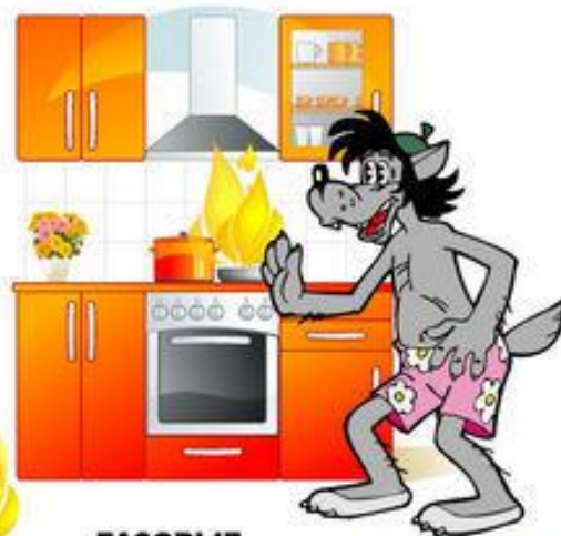
ГАЗОВЫЕ И ЭЛЕКТРИЧЕСКИЕ ПЕЧИ