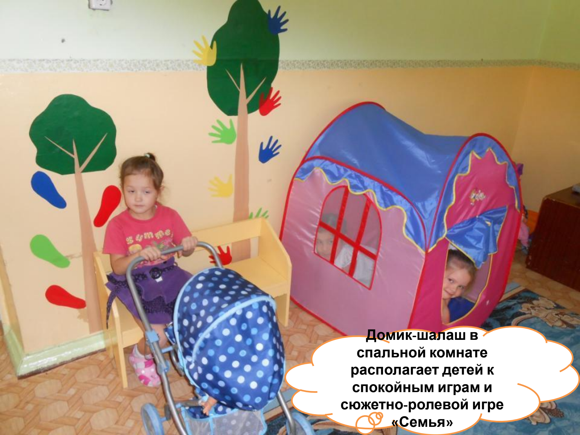
Домик-шалаш в спальной комнате располагает детей к спокойным играм и сюжетно-ролевой игре «Семья»