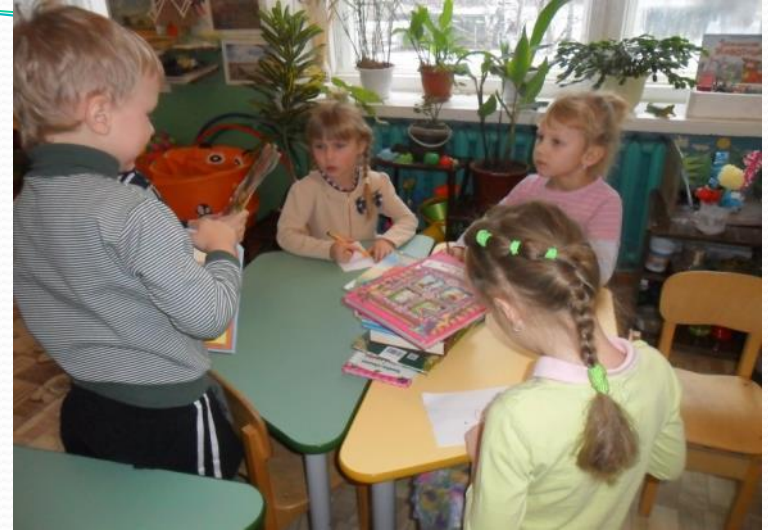
«Моя мама – библиотекарь»