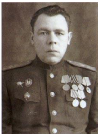
Тимошенко Константин Григорьевич, начальник Управления НКГБ (НКВД) Краснодарского края (апрель 1941 г. - апрель 1943 г.)