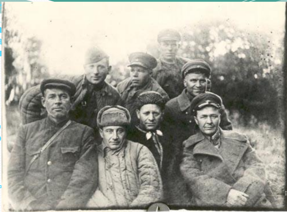
Партизаны Ладожского партизанского отряда с командирами 23-го полка погранвойск НКВД. Лагонаки, октябрь 1942 г.

Наибольшую известность среди этой категории операций, проведенных партизанами в сентябре 1942 года, получил налет партизан отряда им. Гастелло Апшеронского района на гарнизон в поселке Конобоз. Налет был совершен на рассвете 27 сентября, в воскресенье, после тщательной разведки, силами 64 партизан, в том числе группы из 18 автоматчиков. На месте боя осталось 50 (по другим данным 90) убитых гитлеровцев, много раненных. Партизаны захватили станковый пулемет, сожгли весь лесоматериал и скрылись.