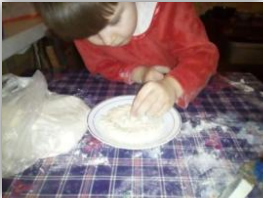
Вместе с Мамой!