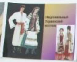
Народный украинский костюм

Украинский народный костюм отличается яркими красками, узорами, вышивкой. Женщины носят длинные юбки с вышивкой, а мужчины - рубашки с вышивкой на воротнике и манжетах.