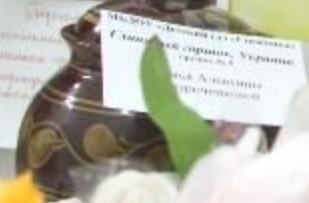
Медоу «Детский сад «Снежинка»