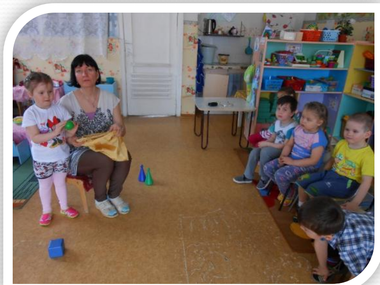
«Узнай на ощупь»