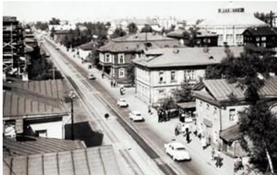
Архангельск — Архангельск. № 10 Вид с высоты 100 метров.