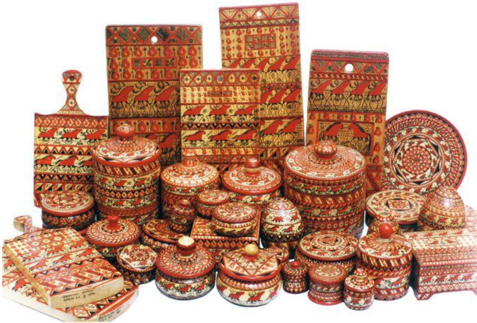
Мезенская роспись по дереву