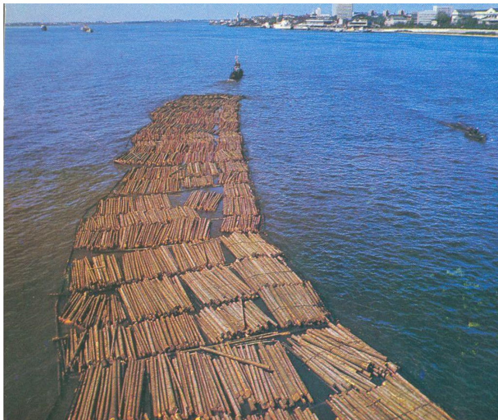
Сплав леса по Северной Двине.