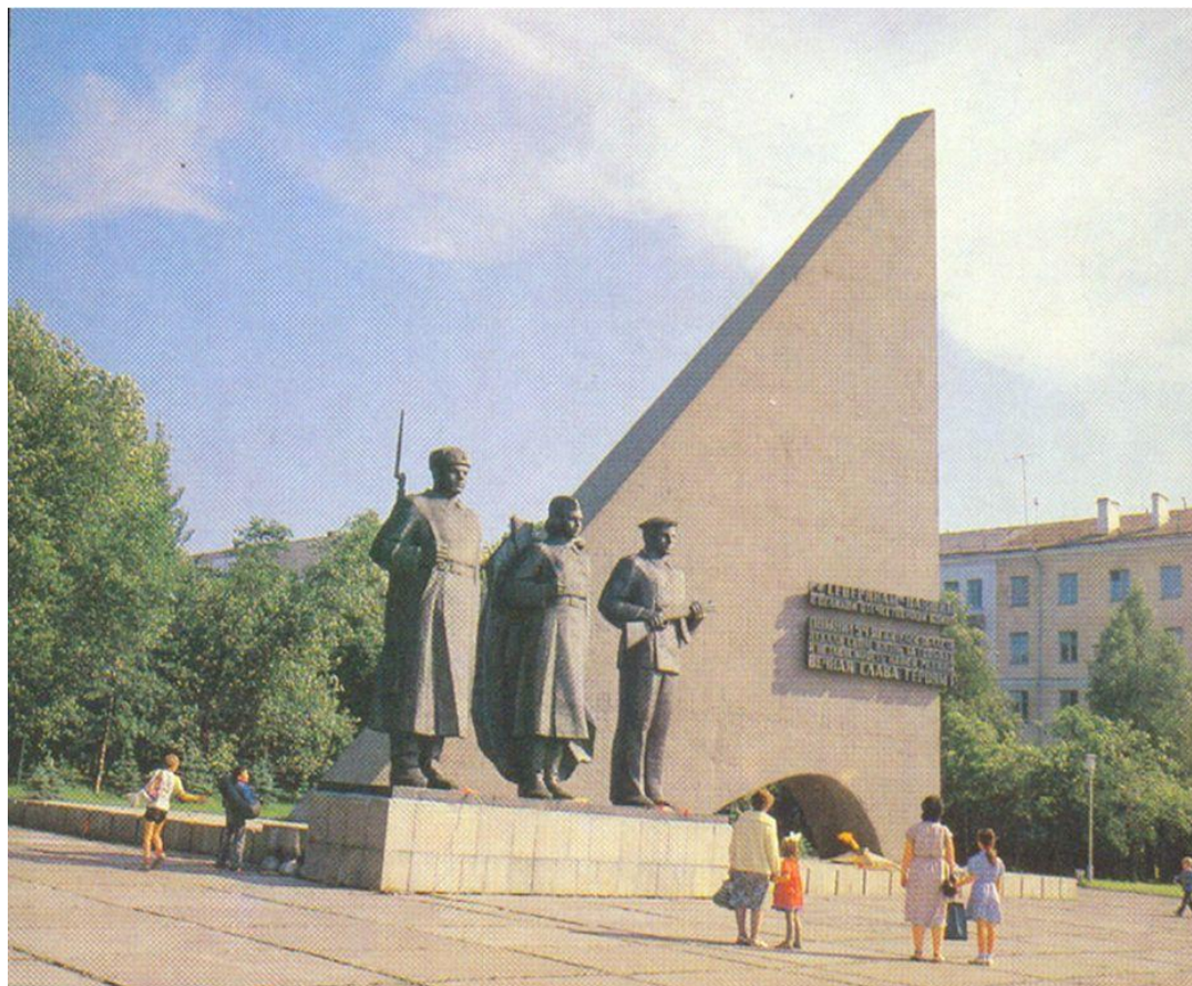
Монумент Победы на площади Мира.