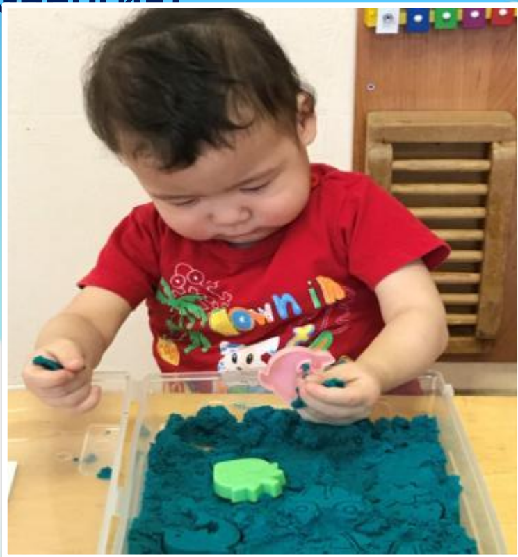
Игра «Следы- узоры»

Стабилизируют эмоциональные состояния, поглощая негативную энергию: