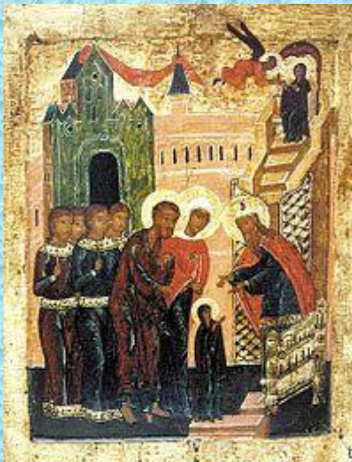
Введение во храм Пресвятой Богородицы (икона, XVI век)