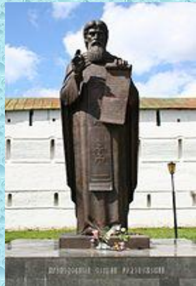
Памятник Сергию Радонежскому в Сергиевом Посаде.