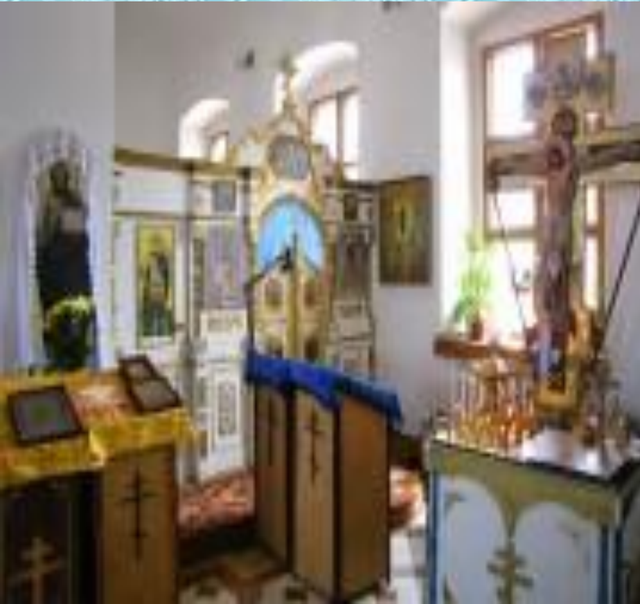
Введенская церковь в Кашире. Иконостас правого Воздвиженского придела.