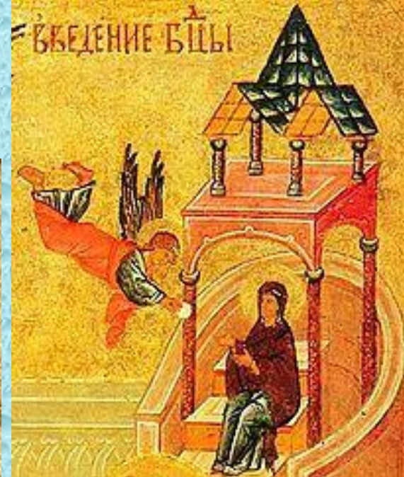
Ангел питает Марию в Храме (деталь иконы, XVI век)