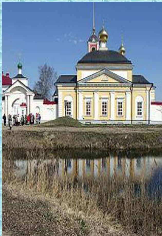
На том, месте где родился Сергий, построен Варницкий монастырь.