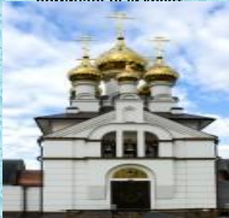
Купола церкви Троицы Живоначальной в селе Вослинка