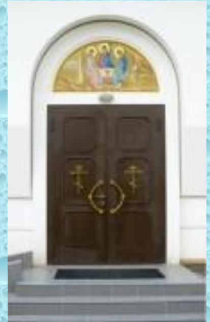
Великие двери храма.