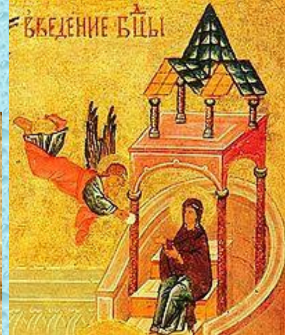
Ангел питает Марию в Храме (деталь иконы, XVI век)