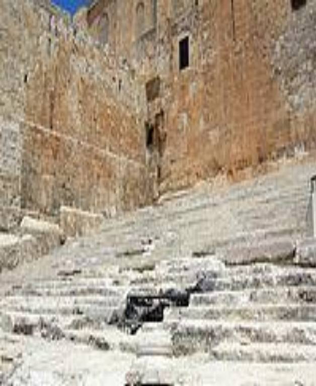
Древняя лестница, по которой молящиеся поднимались на Храмовую гору.