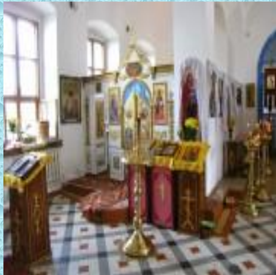
Введенская церковь в Кашире. Иконостас левого Космодамианского придела.