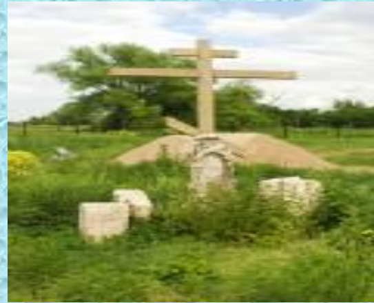
Сохранившиеся надгробия от старого кладбища и поминальный крест