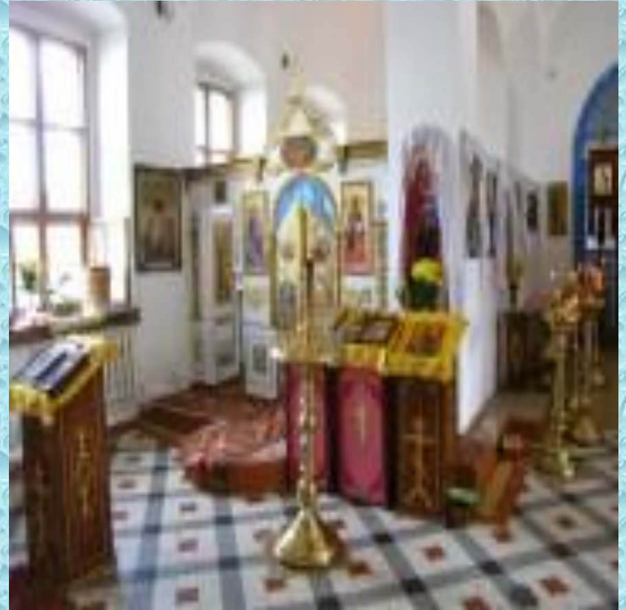
Введенская церковь в Кашире. Иконостас левого Космодамианского придела.