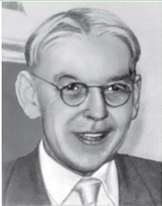
Б. М. Теплов