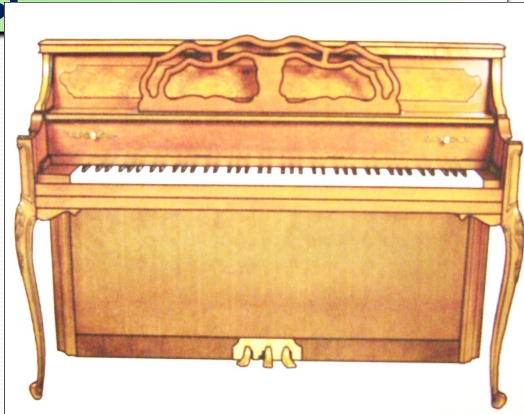
ФОРТЕПИАНО = ПИАНИНО