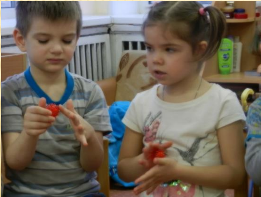
Массаж кольцевыми пружинами