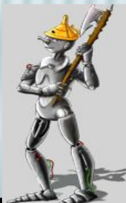
Железные й дровосек