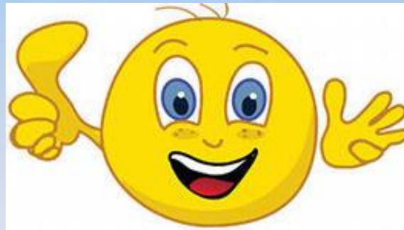
Радостное и позитивное настроение