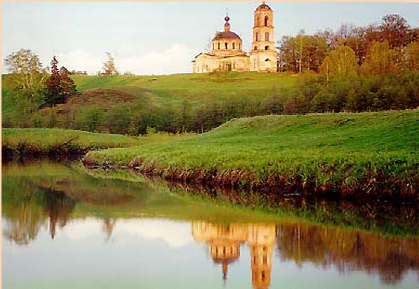
Храм на берегу реки.