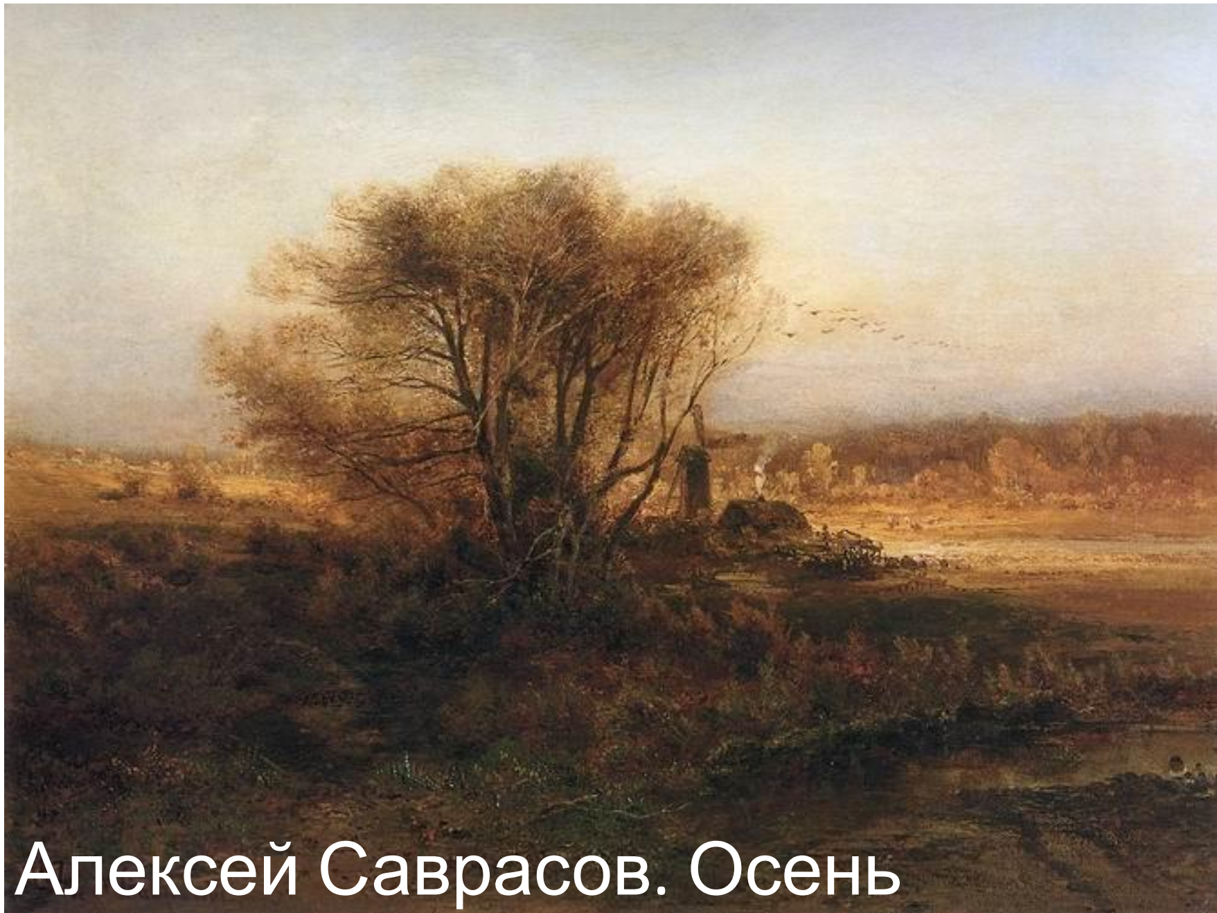
Алексей Саврасов. Осень