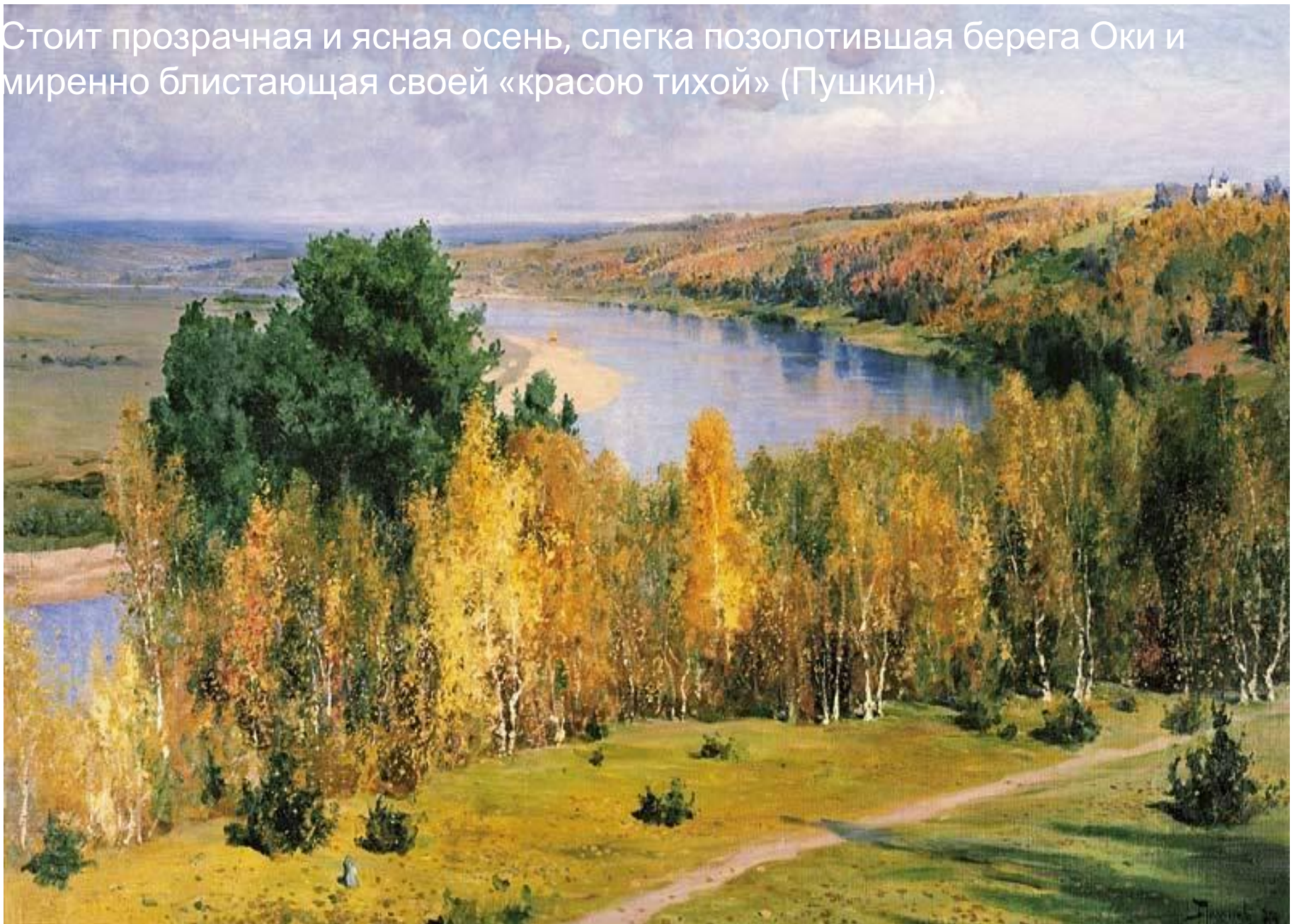
Василий Дмитриевич Поленов. Золотая осень

Стоит прозрачная и ясная осень, слегка позолотившая берега Оки и миренно блистающая своей «красою тихой» (Пушкин).