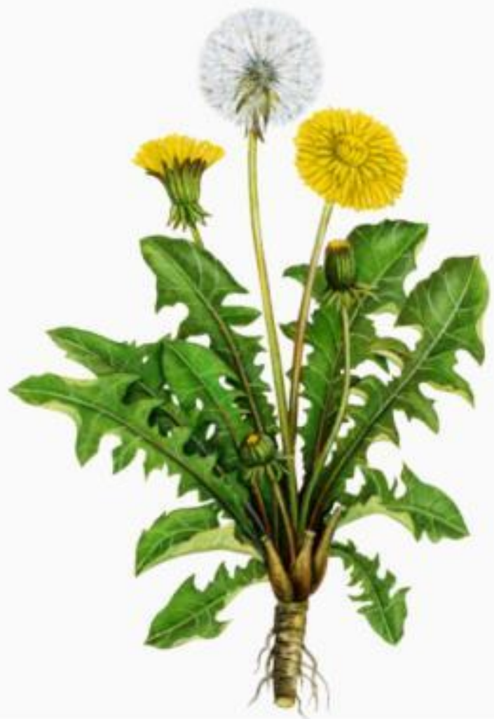
Рис 6. Одуванчик лекарственный