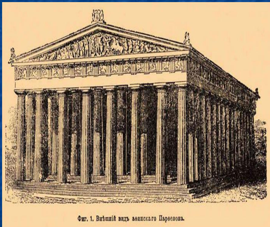
Фиг. 1. Видный вид афинского Партеона.