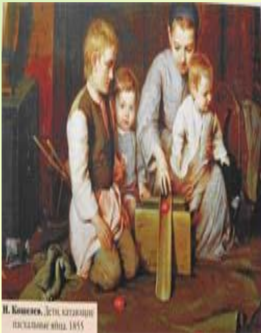
И. Ковалев. Дети катают пасхальные яйца. 1885

В течение сорока дней Пасхи, а особенно на первой неделе — самой торжественной — ходят друг к другу в гости, дарят крашеные яйца и куличи, играют в пасхальные игры. Особой популярностью у российской ребятни в старину пользовалась игра «Катание яиц».