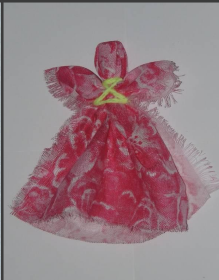
«Отдарок на подарок» (Кукла вежливости) «Каждый подарок любит отдарок» – народная пословица