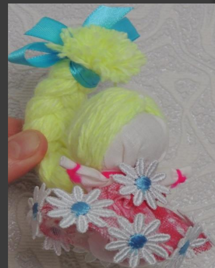
Кукла с косой Куколка «Счастье» - это маленькая девочка с поднятыми к солнцу ручками. Коса, как символ женской силы, символизирует здоровье, достаток, красоту, долгую жизнь. Лучше всего, если коса направлена вперед и вверх – к новым достижениям, к новым успехам.