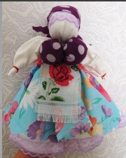
Кукла "Столбушка" (Кукла для беседы и игры)