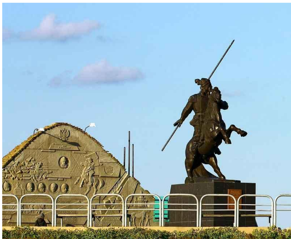
Памятник атаману Бакланову на Набережной