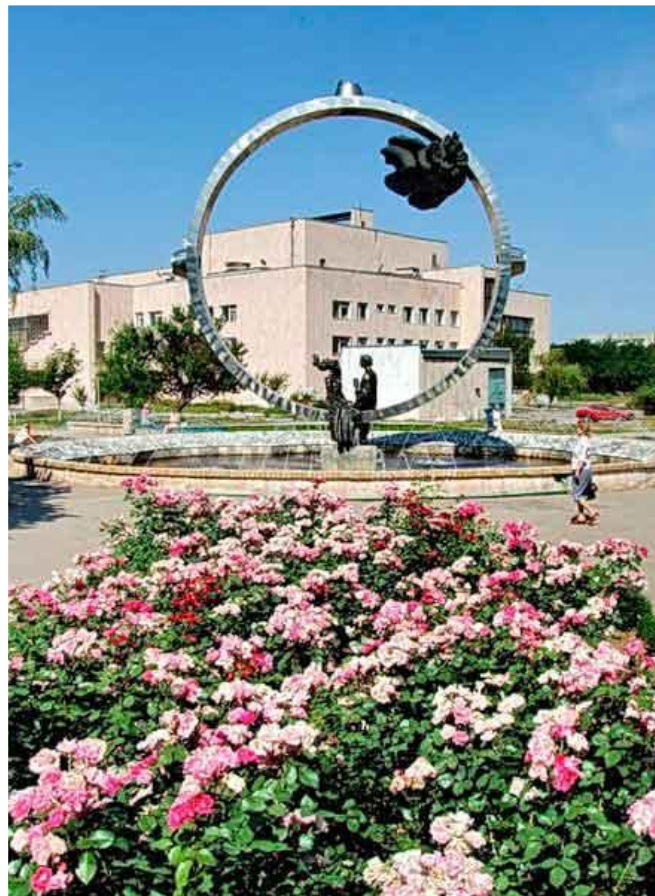
Фонтан - скульптурная композиция "Любовь"