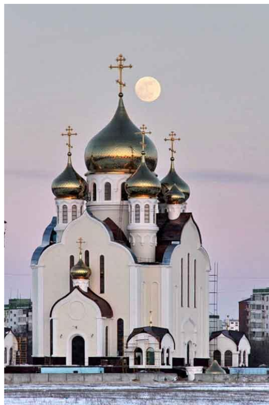
Храм Христу Спасителю