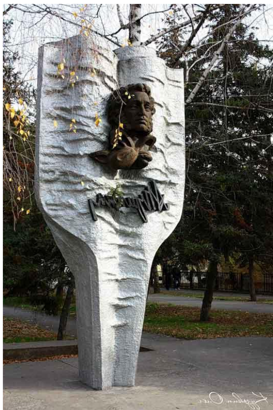
Памятник А.С. Пушкину