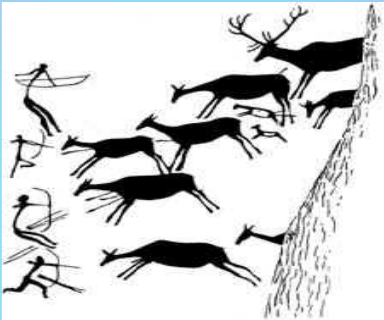
Пиктография. Охота на оленей. Наскальная живопись. Испания